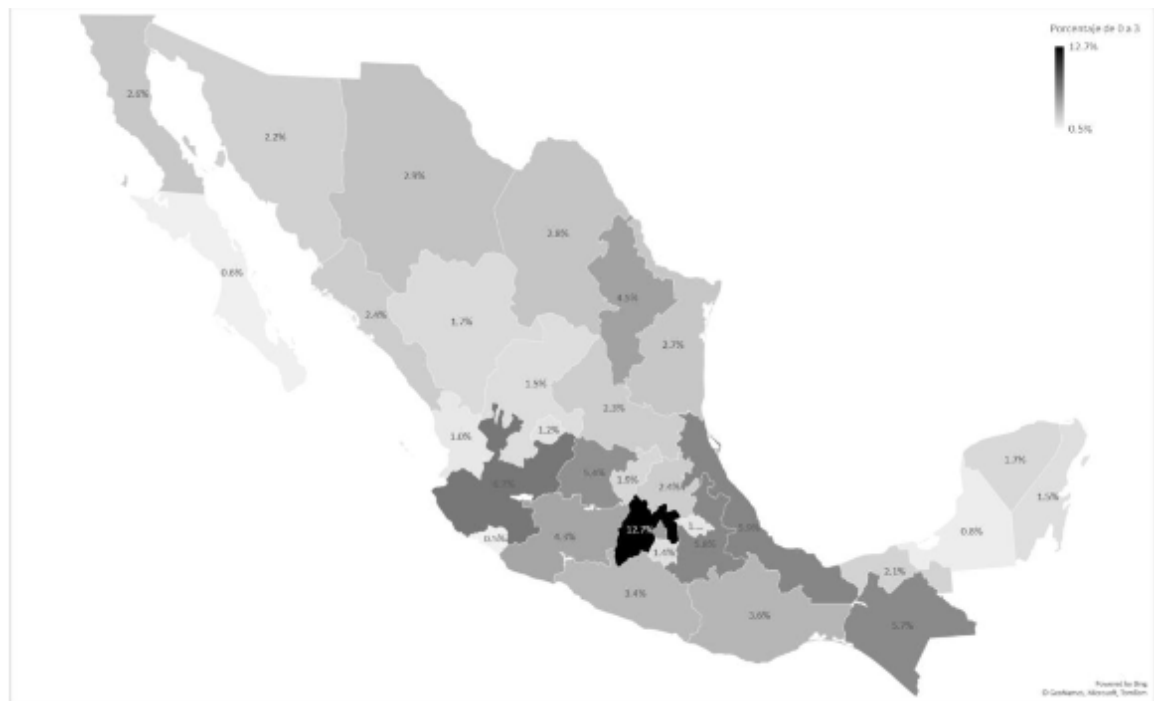
Mapa 1. Distribución del porcentaje total de niñas y niños de cero a tres años en el país