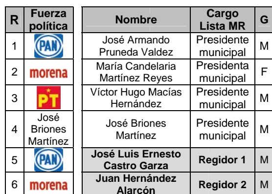
Asignación conforme al orden de planilla de mayoría relativa