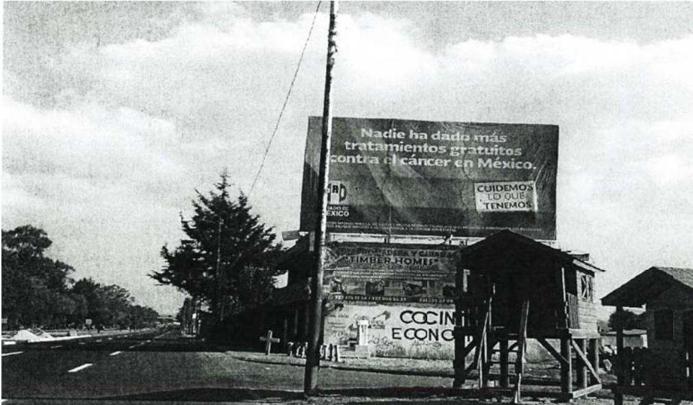
“Nadie ha dado más tratamientos gratuitos contra el cáncer en México”, “Emblema del PRI”; “CUIDEMOS LO QUE TENEMOS”

Por otra parte, con relación del diverso promocional del gobierno federal, que MORENA identificó como “SCT SPOT Corredor México-Tuxpan/Spot Inauguración”, al realizar la aludida diligencia la Unidad Técnica de lo Contencioso Electoral de la Secretaría Ejecutiva del INE, se advirtió lo que a continuación se señala: