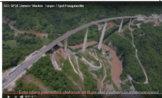
Esta obra permitirá detonar el flujo del comercio internacional