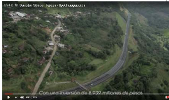
Voz hombre: con una inversión de 8,939 millones de pesos

En pantalla se visualiza una carretera y un camino de tierra rodeados por árboles. Después aparece una caseta de cobro con 6 carriles; un letrero donde se visualiza "MÉXICO... GOBIERNO DE LA REPÚBLICA. MOVER a MÉXICO. AUTOPISTA MÉXICO-TUXPAN TRAMO NUEVO NECAXA-ÁVILA CAMACHO cerca de dos túneles una carretera; se visualiza un camino en movimiento; un camino en movimiento dentro de un túnel; un puente elevado en medio de árboles; un tráiler en movimiento en un camino rodeado de árboles; un puente corto sobre un lago rodeado de viviendas y áreas verdes; otra carretera rodeada de árboles; un puente elevado por donde pasa un camión rojo.