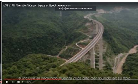
e incluye el segundo puente más alto del mundo en su tipo.