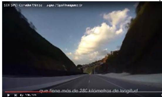
que tiene más de 280 kilómetros de longitud