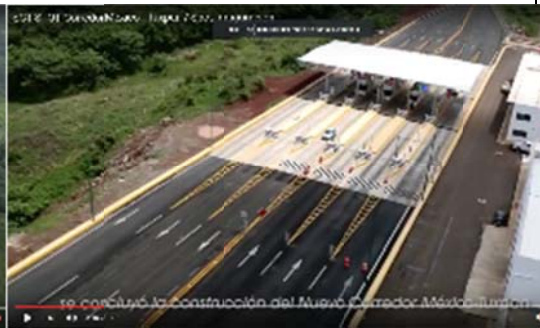
se concluyó la construcción del Nuevo Corredor México-Tuxpan