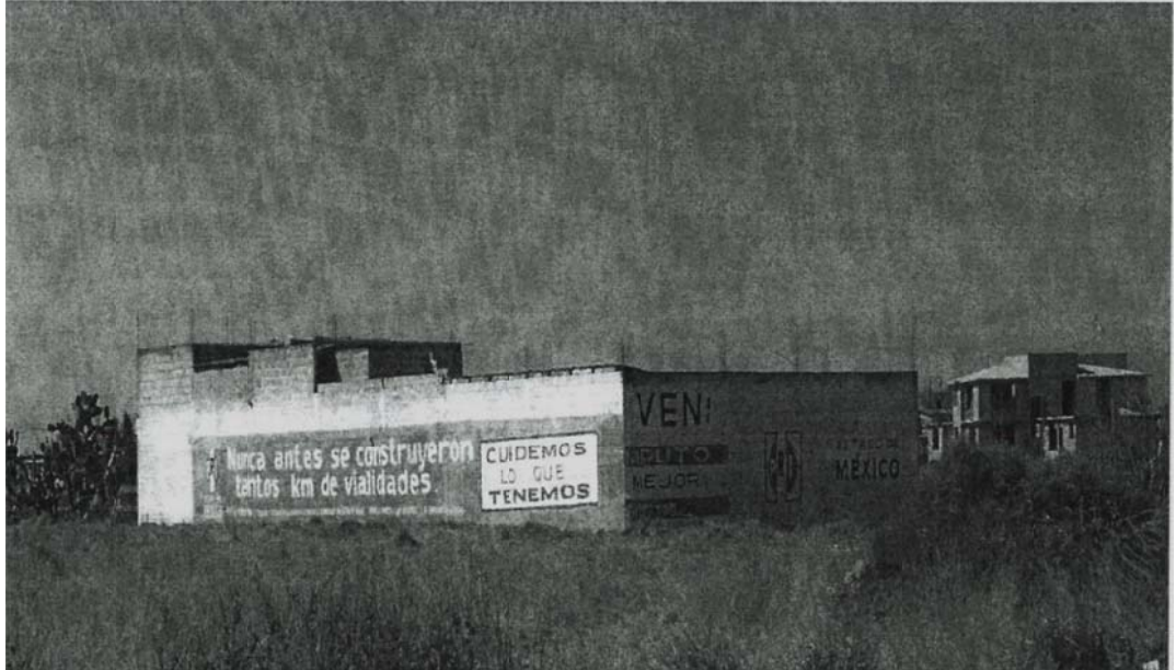
“Nunca antes se construyeron tantos Km de vialidades”; “Emblema del PRI”, “CUIDEMOS LO QUE TENEMOS”. (Pinta de barda ubicada en la calle José Vicente Villada s/n, a un costado de la escuela primaria “Sentimientos de la Nación”, en San Andrés Cuexcontitlán, Toluca, México).