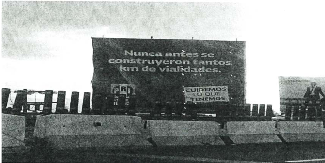
“Nunca antes se construyeron tantos Km de vialidades”; “Emblema del PRI”, “CUIDEMOS LO QUE TENEMOS”. (Espectacular ubicado en la Avenida Paseo Toluca en la Colonia Izcalli, Toluca, México, frente a la Comercial Mexicana).

Por lo que se refiere a los tres espectaculares, tienen en contenido que se precisa enseguida: