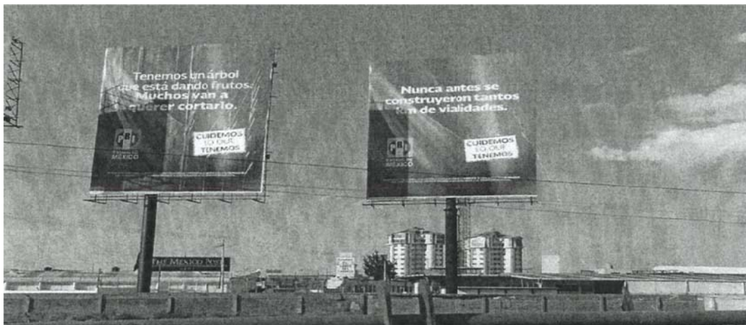
“Tenemos un árbol que está dando frutos. Muchos van a querer cortarlo” “Emblema del PRI”, “CUIDEMOS LO QUE TENEMOS”. (Espectacular ubicado en la Avenida Paseo Toluca casi esquina Fidel Velázquez, Toluca, México).