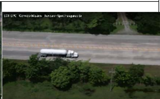
entre el Centro del país y el Golfo de México