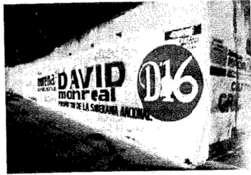
Tres bardas con las características: