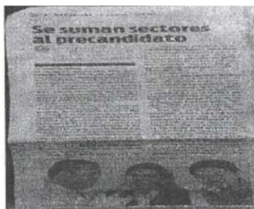
Imagen 2. De la sección Política, página 2 del Periódico "QUEQUI"

Se observa el encabezado "Se suman sectores al precandidato" "CONTINUARÁ LA TRANSFORMACIÓN DEL ESTADO, DIJERON LÍDERE"; dicha nota periodística hace