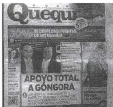
Imagen 1. Portada del Periódico "QUEQUI"