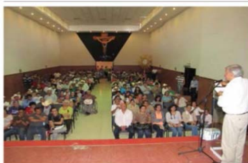
La foto que causó críticas en las redes sociales. MÉXICO, D.F. (aprox.) - La celebración de un mitin de Andrés Manuel López

Para efectos ilustrativos, se inserta la siguiente imagen, aportada por los quejosos.