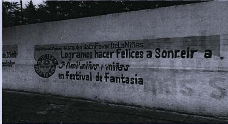
FOTO 7. Se trata de una barda con el fondo pintado de color blanco con varias leyendas, del lado superior izquierdo se puede leer "Consejo Delegacional la Magdalena C." seguido de la leyenda "#Izquierda En favor De La Niñes", en la parte de abajo del lado izquierdo se puede apreciar un circulo de color negro con la leyenda pintada en letras blancas "GOBIERNA PARA TU BIEN" y en el centro de ese circulo el logotipo y letras color negras del "PRD-DF", por último del lado derecho del circulo la leyenda "Logramos hacer Felices a Sonreír a 3mil niños y niñas en Festival de Fantasía".

FOTO 8. Se trata de una barda con el fondo pintado de color blanco con varias leyendas, del lado superior izquierdo se puede leer "Consejo Delegacional la Magdalena Contreras." seguido de la leyenda "#Izquierda Que gobierna", en la parte de abajo del lado izquierdo se puede apreciar un circulo de color negro con la leyenda pintada en letras blancas "GOBIERNA PARA TU BIEN" y en el centro de ese circulo el logotipo y letras color negras del "PRD-DF", por último del lado derecho del circulo la leyenda "En 2 años logramos cero crecimiento en mancha urbana. #Juntos Somos Más En favor De Nuestro Suelo de Conservación".