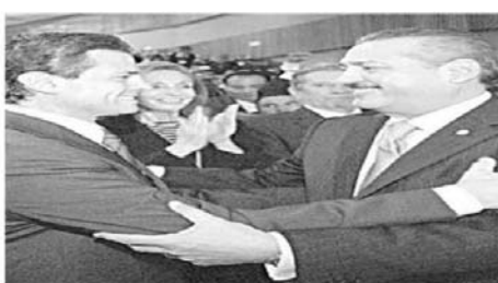
ENRIQUE PEÑA NIETO. Durante la sesión, Peña Nieto se levantó a saludar a Peña Nieto, ex gobernador del Estado de México, quien fue su oponente.

El ex gobernador del Estado de México planteó que al interior de su partido hay muchas figuras que le merecen respeto y toda su consideración. Peña Nieto se refirió también a la designación pendiente de tres consejeros electorales para el IFE. Expresó su deseo de que cuanto antes los partidos políticos encuentren los mecanismos o la fórmula que les permita definir esa terna, porque mientras tanto se deja al árbitro electoral 'en una condición todavía de debilidad'. Sin embargo, dijo que esto no impide que al actual Consejo General del IFE continúe su trabajo."