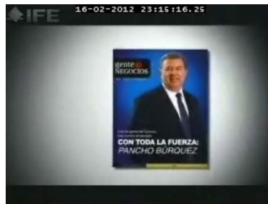
“...Gente y negocios...”

Promocional en televisión que de forma gráfica se describe a continuación: