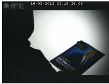
...en su primera edición: Rumbo al senado...

Inmediatamente se observa en un fondo color café siluetas de personas y al centro una correspondiente al parecer del sexo femenino quien porta en sus manos una revista.