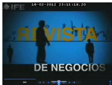
...la revista de las tendencias de negocios en Sonora...

El promocional inicia con la presentación de la imagen de la portada correspondiente al número 1, en la que se aprecia en el ángulo superior izquierdo el título de la revista “Gente y Negocios” (con letras negras y rojas en un recuadro negro); asimismo, con un fondo azul se observa la imagen del C. Francisco de Paula Búrquez Valenzuela, ocupando la mayor parte de ésta y al pie se lee lo siguiente: “Con la gente de Sonora, voy rumbo al Senado...” (Letras pequeñas en color blanco), posteriormente con mayúsculas...CON TODA LA FUERZA... (Letras más grande en color blanco),... PANCHO BÚRQUEZ ” (en letras cursivas).