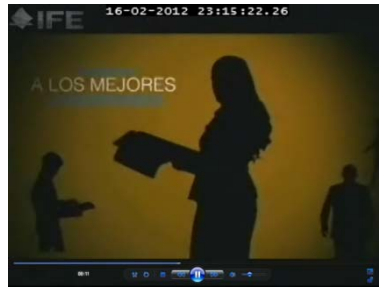
...te presenta los mejores sonorenses...

Inmediatamente se observa en un fondo color café siluetas de personas y al centro una correspondiente al parecer del sexo femenino quien porta en sus manos una revista.