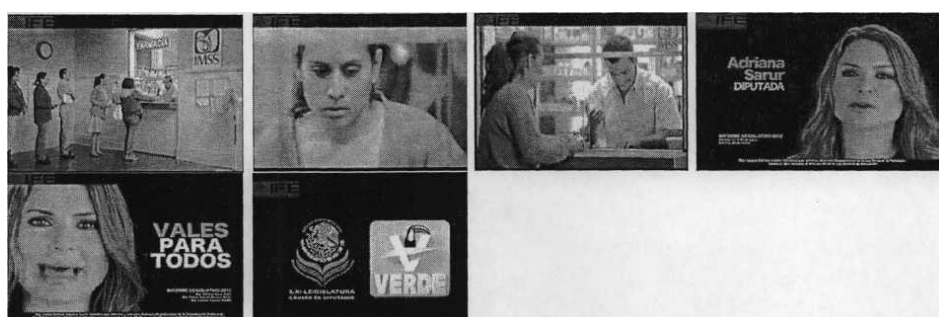
Promocional Informe de labores