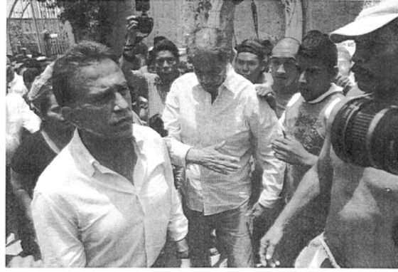
En esta imagen se puede apreciar a César del Ángel Fuentes del lado derecho de la imagen vistiendo unos jeans color azul claro y camisa blanca con rayas, así como al candidato de la Coalición "Viva Veracruz" Miguel Ángel Yunes Linares.