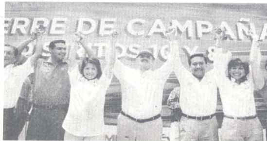
El alcalde de Morelia, Fausto Vallejo, levanta la mano a los candidatos priístas.

En la Plaza Melchor Ocañino, Fausto Vallejo les reconoció a los abanderados que realizan una campaña de propuestas y no de descalificaciones, «ustedes no han hecho una campaña a través de las despensas, del cemento, de la compra de conciencias y eso tiene un valor extraordinario en nuestro país y en Michoacán, que está sumido en una crisis de valores espantoso y del cual debemos de salir todos».